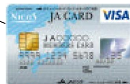
ポイント付JAカード(一体型)