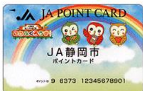
ポイント専用カード