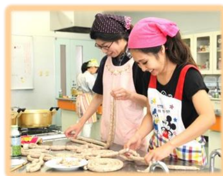
「ソーセージづくり」