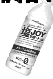
塩 JOY サポート 24本入り1ケース 税込 1,980円