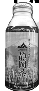
JA静岡茶 24本入り1ケース 税込 2,592円