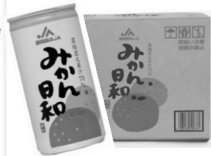
みかん日和 30本入り1ケース 税込 2,570円